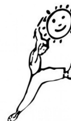
Théâtre de la Clarté

La proposition a évidemment pour finalité supplémentaire la mise en place d'une représentation en fin d'année, celle-ci veille à mettre en valeur la personnalité de chacun, en fonction de ce qu'il est et fera prévaloir le groupe sur l'individu. La base d'un texte classique est adaptée en conséquence à cette fin.