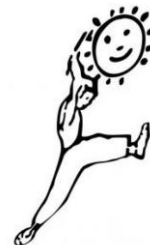
Théâtre de la Clarté

Le Collège Dupanloup a construit un partenariat avec le Théâtre de la clarté de Boulogne-Billancourt afin de proposer 60 places de cours de théâtre à nos élèves de 6 ème et 5 ème (deux groupes de 20 places chacun en 6 ème , un groupe de 20 en 5 ème ), et ce dans les locaux de Dupanloup.